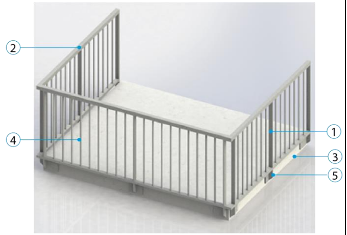
Fixation à l'anglaise